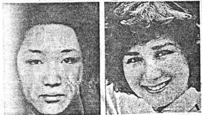
da estetik ameliyat gerçekleştirildi. Yukarıdaki fotoğraflarda, estetik üliyor.