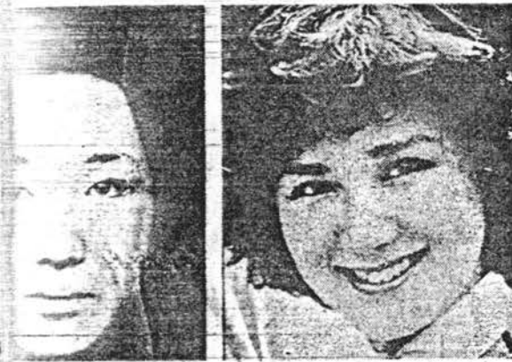
Estetik gerçekleştirildi. Yukarıdaki fotoğraflarda, estetik